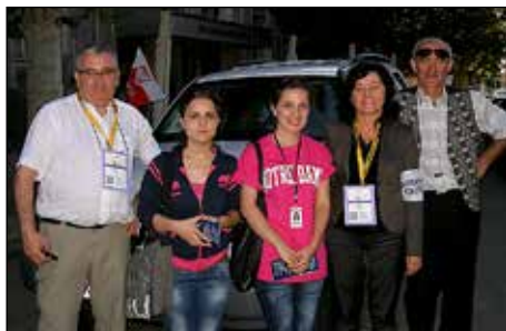
Gruzja, październik 2012 r.

obserwacyjne w trakcie wyborów parlamentarnych i prezydenckich w Gruzji.