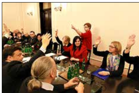
Pierwsze posiedzenie Komisji Ochrony Środowiska w VII kadencji, listopad 2011 r.

W Komisji Infrastruktury uczestniczyłam w pracach 3 stałych podkomisji oraz w 14 podkomisjach powołanych do pracy nad projektami ustaw i rezolucji.