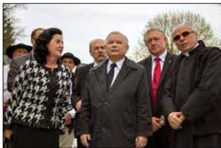
Wizyta Prezesa Jarosława Kaczyńskiego na Podhalu, Ludźmierz, 25.04.2014 r.