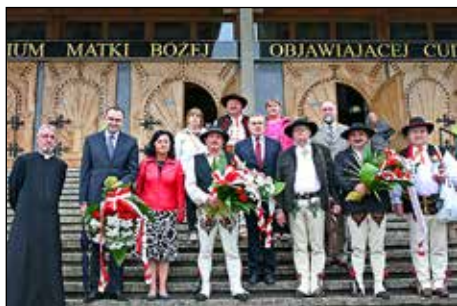
Sanktuarium Matki Bożej Objawiającej Cudowny Medalik, Zakopane Olcza, 10.08.2013 r.