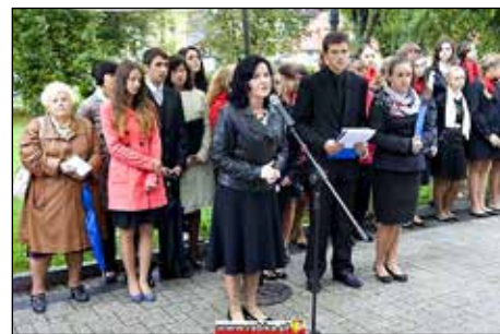
Rocznica napaści sowieckiej na Polskę, Rabka-Zdrój, 17.09.2013 r.