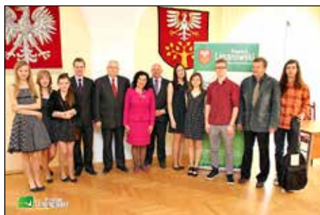
Wręczenie nagród laureatom I Konkursu Piosenki Patriotycznej „Ojczyznę wolną rącz nam wrócić Panie”, Limanowa, 06.05.2013 r.