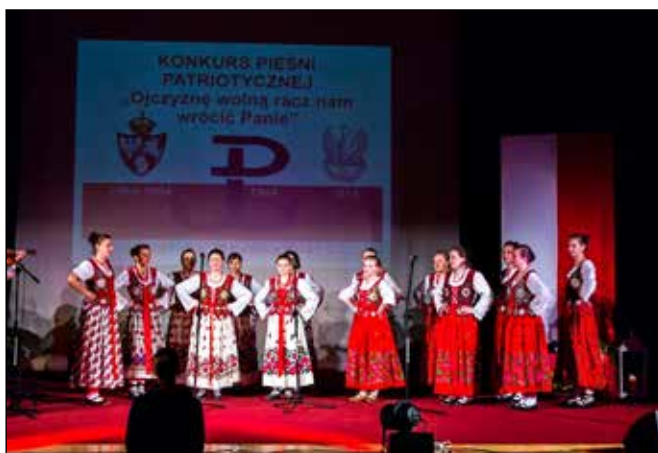
Zespół Skrzypniarki z Gimnazjum ze Skrzypnego - laureat II miejsca w 2014 roku

III Konkurs w r. 2015 był poświęcony upamiętnieniu czynu zbrojnego Legionów Polskich Józefa Piłsudskiego. W tym roku regulamin wymagał wykonania dwóch pieśni ze śpiewnika wydane go przeze mnie na 100-lecie Legionów, w tym obowiązkowo, przygotowania co najmniej jednej, mało znanej pieśni legionowej. Mimo trudnych wymogów regulaminu do udziału zgłosiło się 18 wykonawców: solistów i zespołów. W trzech edycjach konkursu laureaci otrzymali wiele cennych nagród, w tym 10 gitar.