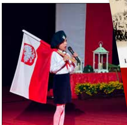
Jedna z najmłodszych uczestniczek II Konkursu