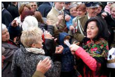
Rozdaje śpiewniki pieśni patriotycznych po uroczystościach w Nowym Targu, 3.05.2014 r.