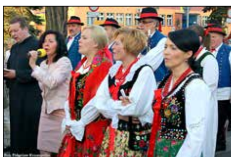
Marsz pamięci w pierwszą rocznicę beatyfikacji Papieża Jana Pawła II, Nowy Sącz, 30.04.2012 r.