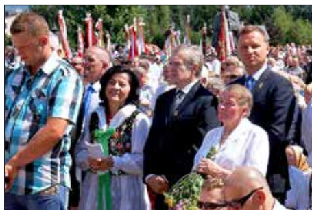
50-lecie koronacji figury Matki Bożej Gaździny Podhala, Ludźmierz, 15.08.2013 r.