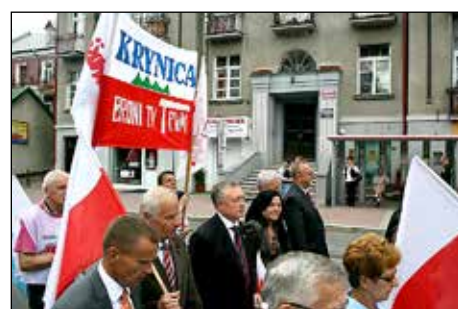
Krynica broni TV Trwam - marsz w obronie wolnych mediów, 16.07.2012 r.