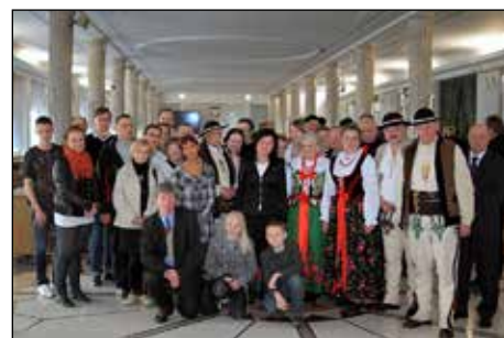
Wizyta w Sejmie - Sala Kolumnowa, 10.04.2012 r.