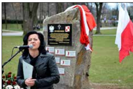
Odsłonięcie Pomnika Katyńskiego w Mszanie Dolnej, 17.04.2013 r.