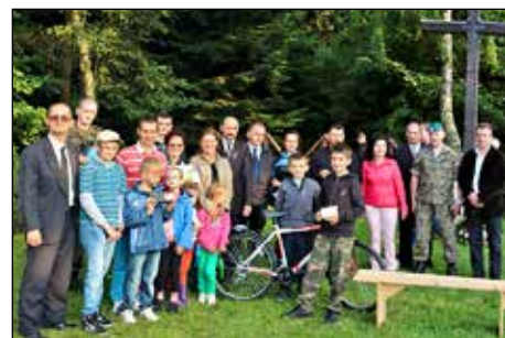
Wręczęm ufundowany przeze mnie rower - główną nagrodę loterii na budowę kaplicy w Kodymie na Ukrainie. Korab-Jaworzna 14.07.2013 r.