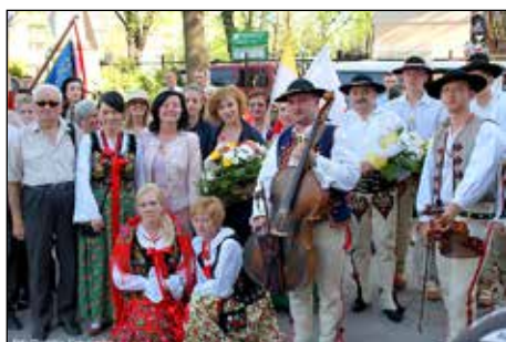
Marsz pamięci w pierwszą rocznicę beatyfikacji Papieża Jana Pawła II, Nowy Sącz, 30.04.2012 r.