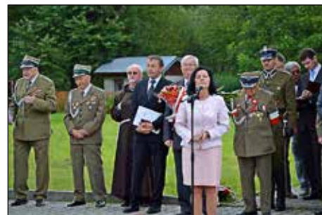
Uroczystości ku czci 1. Pułku Strzelców Podhalańskich AK, Szczawa, 17.08.2014 r.

W trakcie VII kadencji Sejmu uczestniczyłam w 480 wydarzeniach i spotkaniach na zaproszenie: samorządów gminnych, powiatowych, stowarzyszeń, etc.